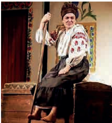
Наталія Сумська в ролі Кайдашихи, вистава „Кайдашева сім'я” Національного академічного драматичного театру імені Івана Франка

► Преведете на български. Озаглавете текста. Преразкажете го.