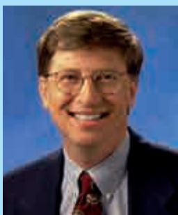
Бил Гейтс – американски програмист и бизнесмен, съосновател на компанията „Microsoft“