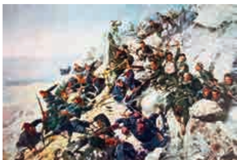
Отбраната на Шипка, август 1877 г.

Българският народ неоднократно възстава срещу византийския гнет и възкресява прежната мощ на своята държава. През тринадесети век българските селяни вдигат първото в Европа антифеодално въстание и поставят на престола пастира Ивайло.