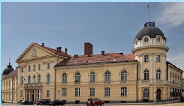
Българска академия на науките – централната сграда на бул. Цар Освободител до Народното Събрание

Академията е основана първоначално като Българско книжовно дружество (БКД) в град Браила, Румъния (1869). През 1878 г. дружеството премества седалището си в София и на 13 февруари 1911 се преименува на Българска академия на науките. През 1940 г. академията е преименувана на Българска академия на науките и изкуствата (БАНИ), като запазва това име до 1947, след което отново се преименува на БАН.