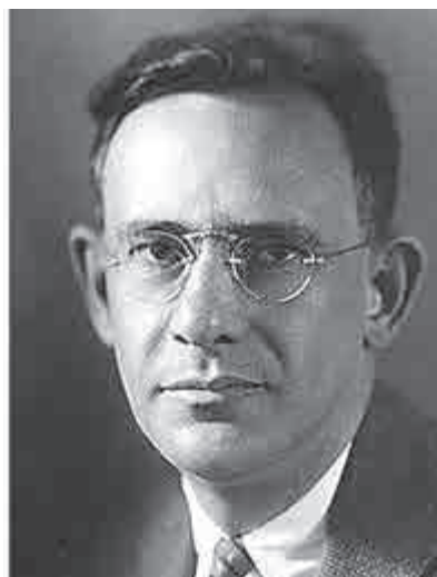
Едуард Сепир (1884–1939) – американски езиковед и антрополог

Напишете есе по тема: „Езиковите клишета в публичното пространство. Винаги ли са признак за лоша езикова култура?“